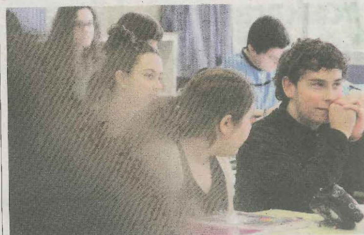
DBH igarota, gaztelarrera igarotzen dira ikasle asko.